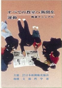
公益社団法人日本新聞販売協会 「すべての教室へ新聞を」 運動 推進マニュアルの表紙

文部科学省の後援のもと、地域の新聞販売店から最寄りの学校へボランティアで新聞を届ける「すべての教室へ新聞を」運動が始まり、今では全国の2421校(平成27年4月現在)で実施されています。大田区でも(3年ほどの準備期間を経て)平成25年4月より87校すべての小中学校へ毎朝、新聞が届けられています。大田区内の全新聞販売店59店【朝日、毎日、読売、産経、東京、日経】で組織された「大田新聞販売同業組合」では、この運動に賛同いただいた大田区教育委員会から後援をいただき、この活動と連携した教育関連の講演会を著名人を招き開催をしております。名称を「この人に聞きたい! 講演会」と題し、大田区内の全小中学校の保護者様、学校関係者様を対象に無料でご招待をさせていただいております。