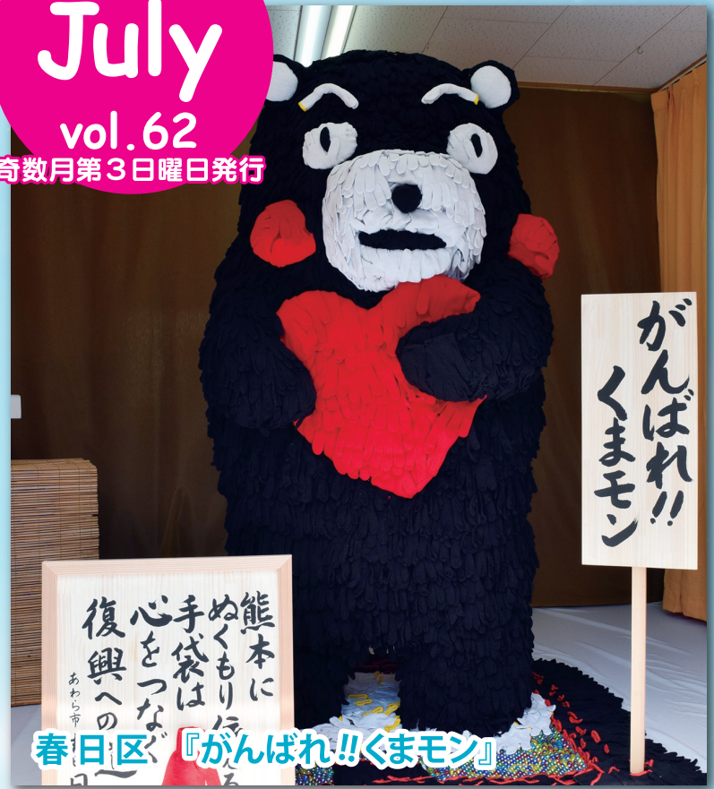
春日区 『がんばれ!!くまモン』