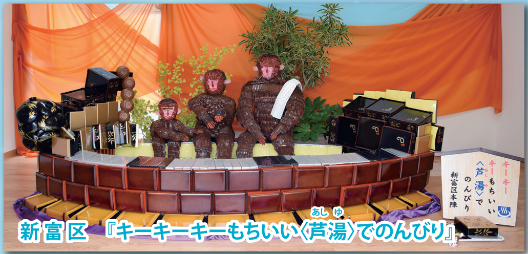
新富区 『キーキーキーもちいい(芦湯)でのんびり』