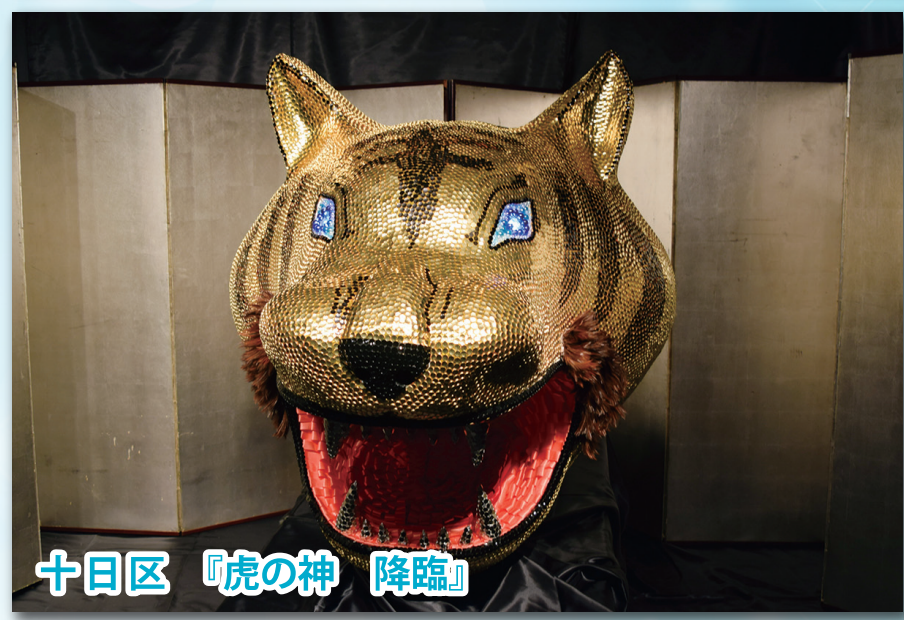
十日区 『虎の神 降臨』