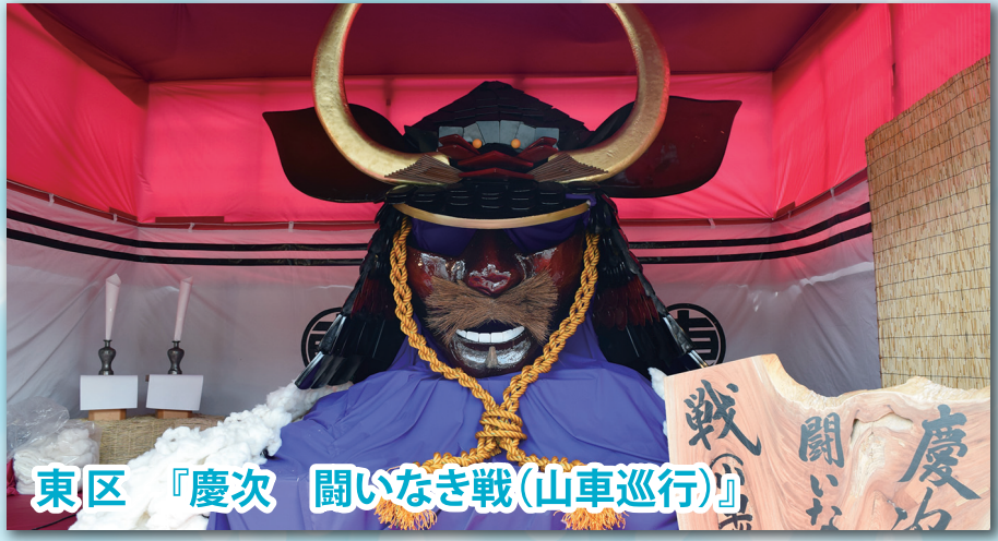
東区 『慶次 闘なき戦(山車巡行)』