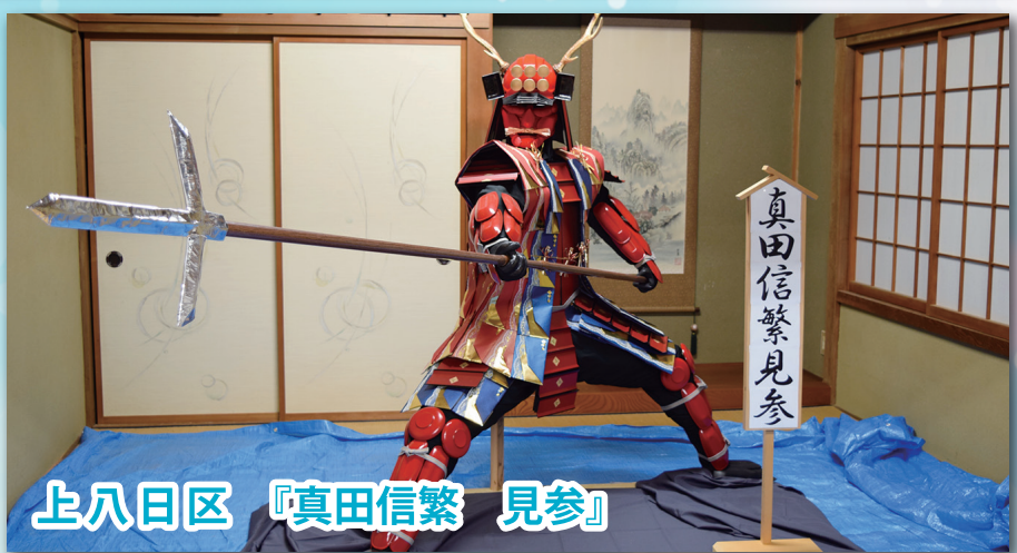
上八日区 『真田信繁 見参』