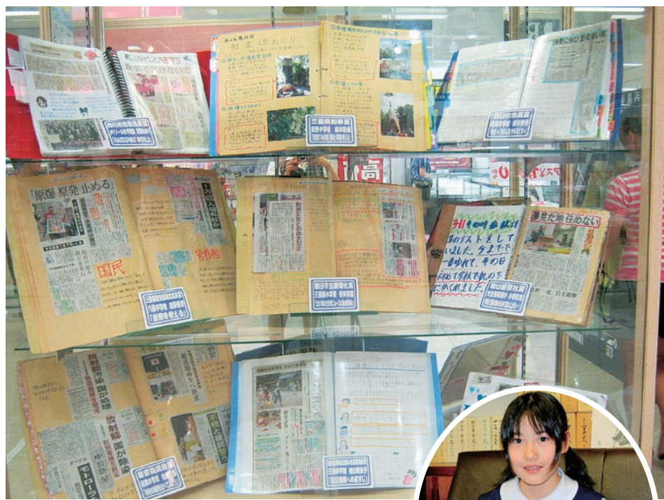
(イオン四日市尾平店)